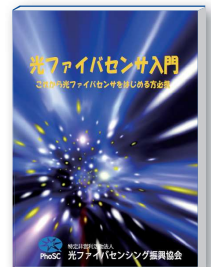
「光ファイバセンサ入門」